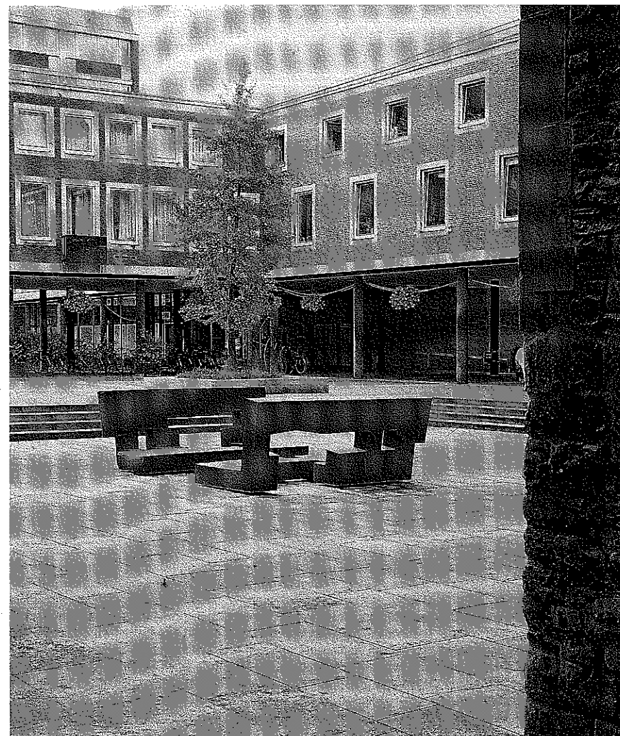
Abb. 1: Eduardo Chillida, Toleranz durch Dialog 1993, Münster, Rathausinnenhof

Eduardo Chillidas Skulptur "Toleranz durch Dialog" ist seit ihrer Übergabe am 18. Mai 1993 zu einem selbstverständlichen Bestandteil des Ambiente um das historische Münsteraner Rathaus geworden. Ein Grund mag darin liegen, daß die Skulptur sich in den ihr zugewiesenen Ort fügt, in gewisser Weise von ihm Besitz ergriffen hat, ohne ihn zu dominieren. Auch gibt der Titel "Toleranz durch Dialog" keine Rätsel auf, sondern findet in der