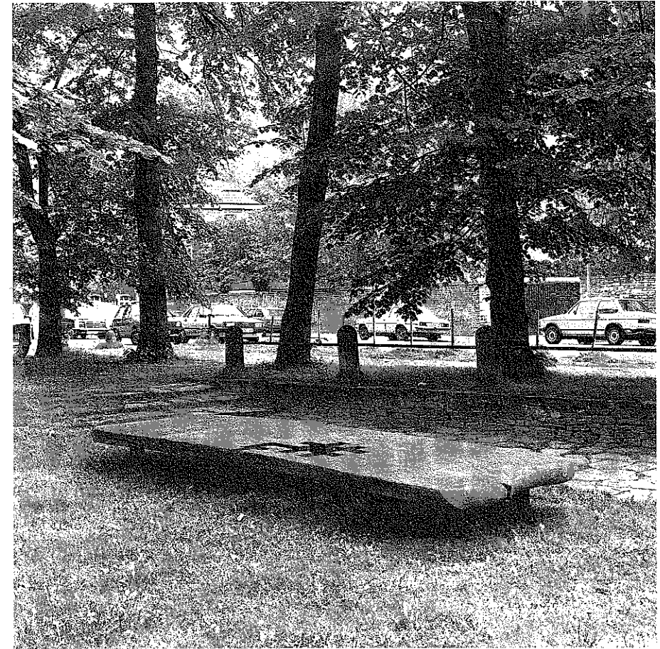
Abb. 2: Eduardo Chillida, Hommage à Luca Pacioli 1986, Aufstellung auf dem Servatii-Kirchplatz 1987

grundsätzliche, alle kulturellen, religiösen und politischen Gegensätze überwindende Verpflichtung zur Toleranz. Eben diesen Aspekt beinhaltet der Verweis auf das historische Datum.