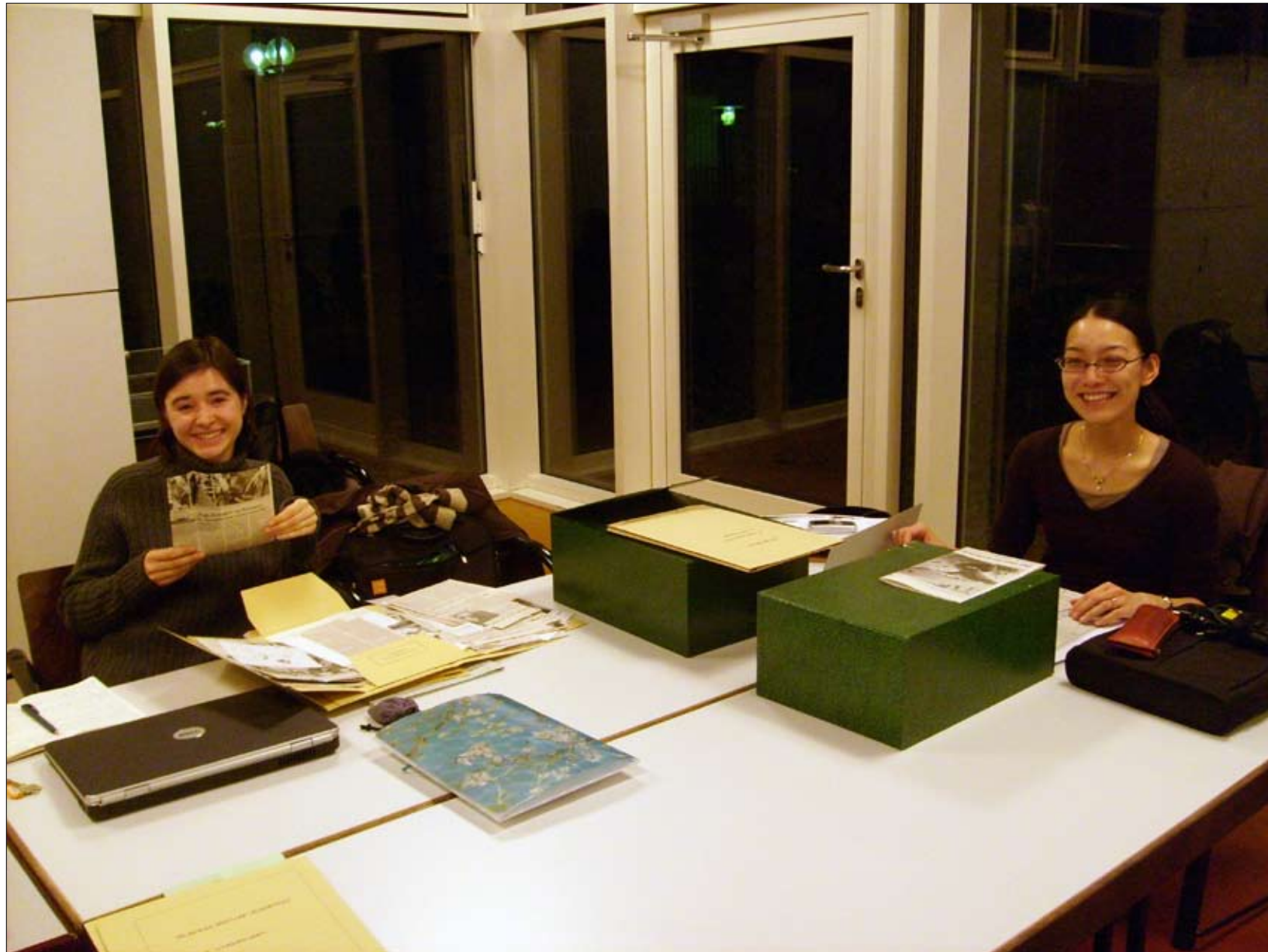
Während der Arbeit: glückliche Funde #3.