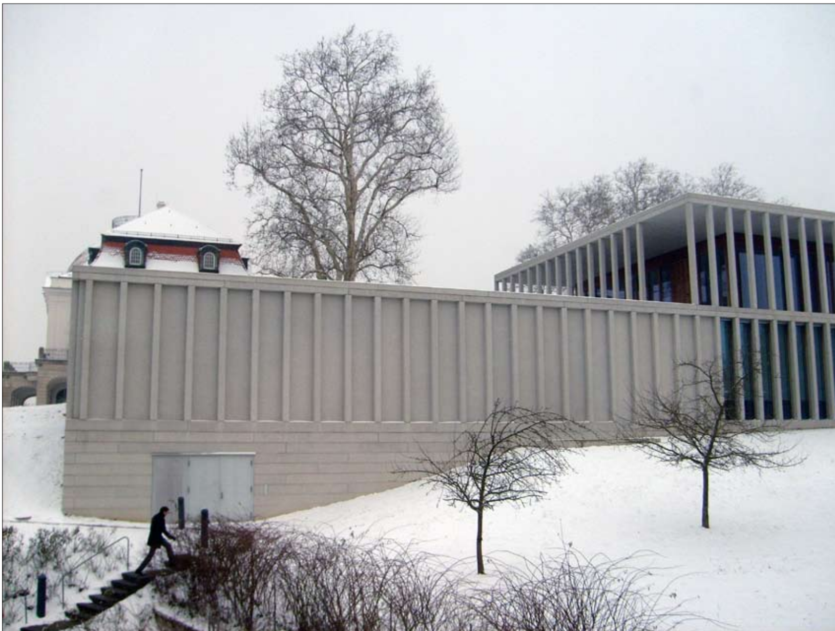
Blick vom Collegienhaus auf das verschneite, von David Chipperfield Architects entworfene Literaturmuseum der Moderne.