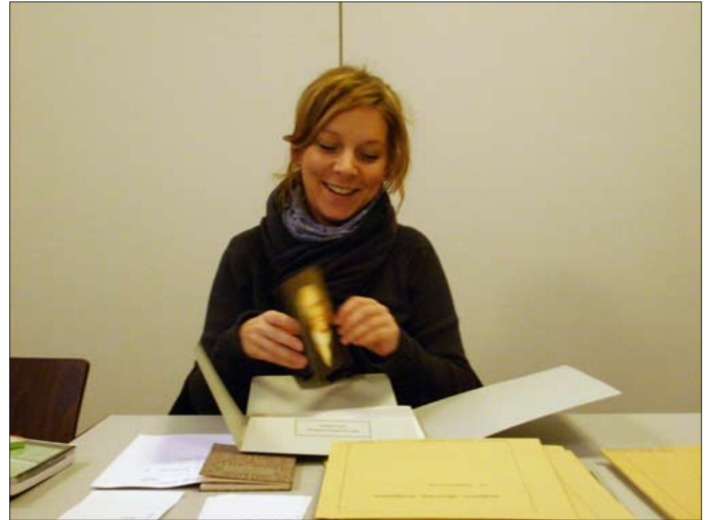
Während der Arbeit: glücklicher Fund #2.