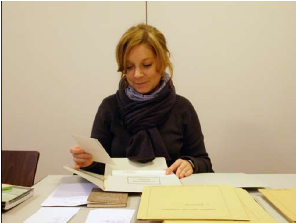
Während der Arbeit: glücklicher Fund #1.