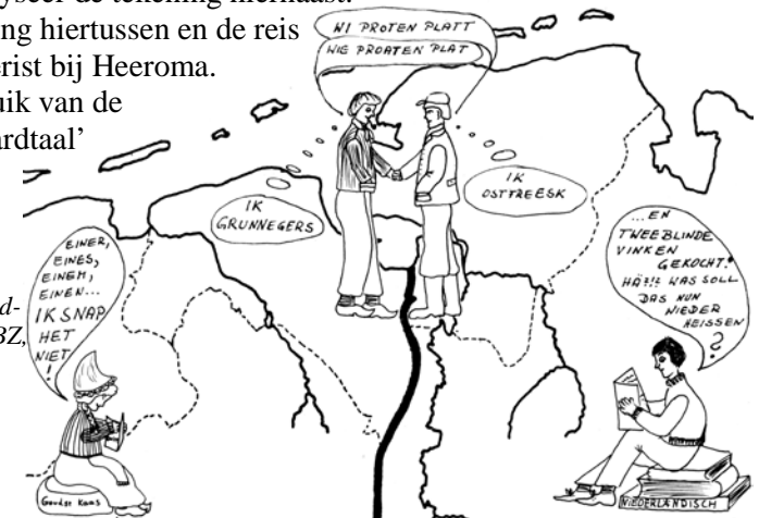
Bron: Eden/Höschel (1987): Sprachformen der Region Ostfriesland-Groningen . Aurich: KBZ, titel

Maak een verbinding hiertussen en de reis van de Engelse toerist bij Heeroma. Maak hierbij gebruik van de begrippen ‘standaardtaal’ en ‘dialect’.