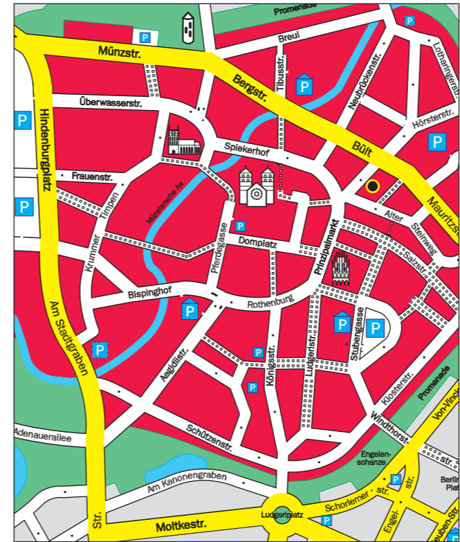
● Haus der Niederlande

Veranstaltung: Kolloquium Zeit: 15. März 2008, 10.30-16.30 Uhr Ort: Rüstkammer des Rathauses Prinzipalmarkt, Münster