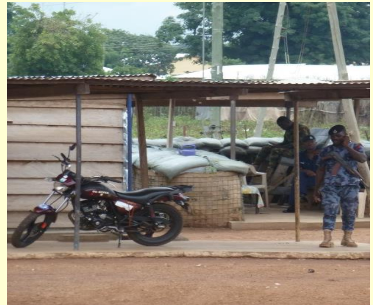
Der Empfang durch den Prinzen der Region – Polizeiwache beim Prinzen