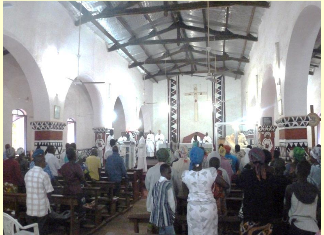
Die Kathedrale von Navrongo von außen - beim Morgengottesdienst in der Kathedrale