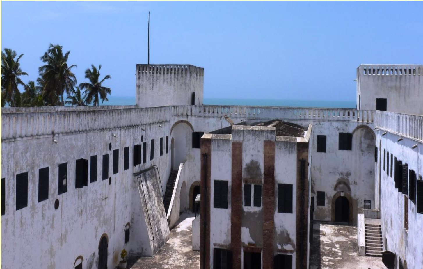
Der Innenhof von ‚Elmina Castle‘ mit der ehem. Kapelle in der Mitte