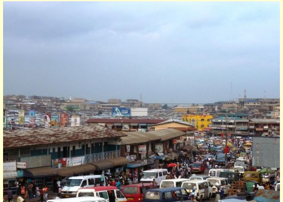
Ein Blick auf das lebhafte Zentrum von Kumasi