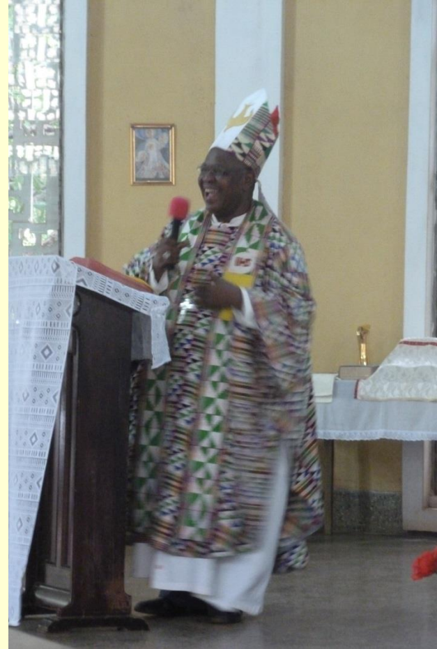
Die Einführung in die jeweiligen Ämter durch den Bischof – Predigt des Bischofs