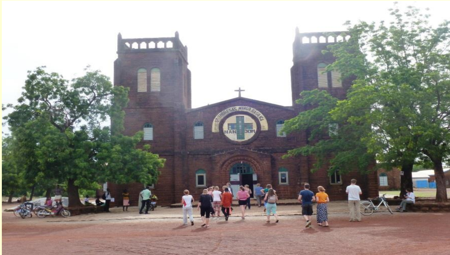
Eine Besichtigung in der Basilica von Nandom