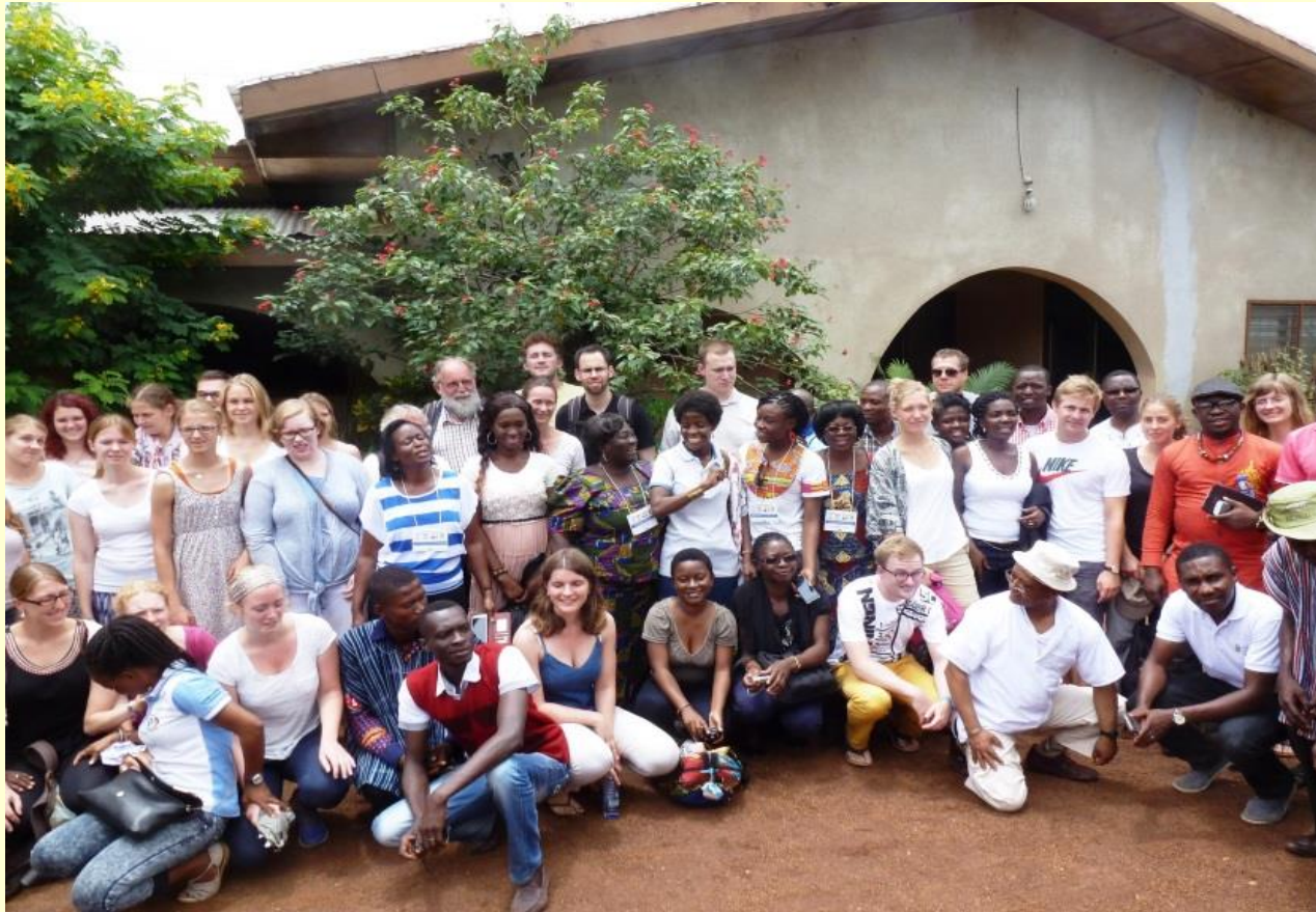
Ein Gruppenbild vor dem Haus des Bischofs von Yendi