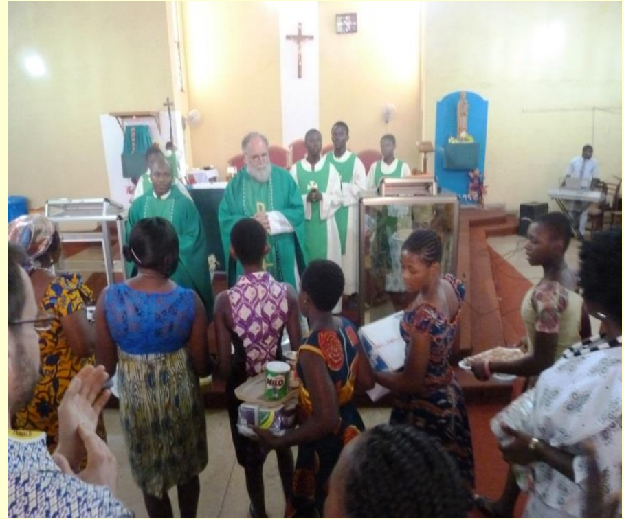
Messe in SS. Peter and Paul - Empfang der Gaben