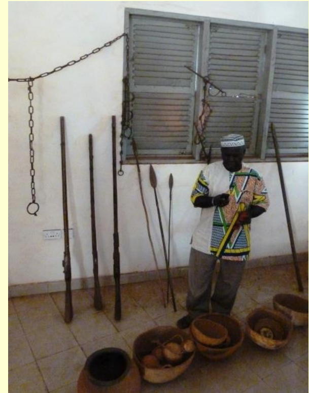
Führung auf dem Gelände des ehem. SklavInnenmarkts - Besichtigung des Museums