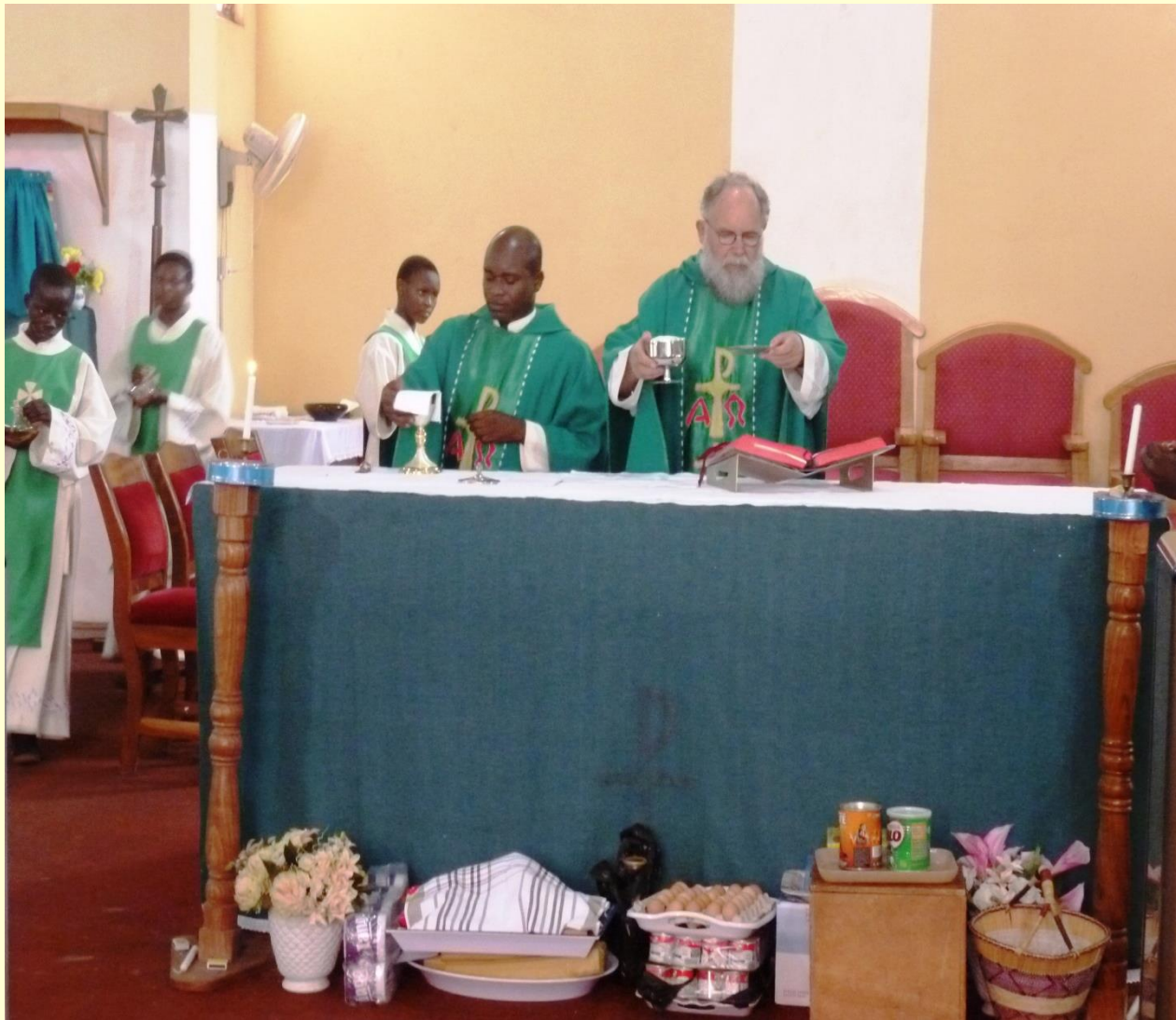
Eucharistiefeier und die empfangenen Gaben vor dem Altar