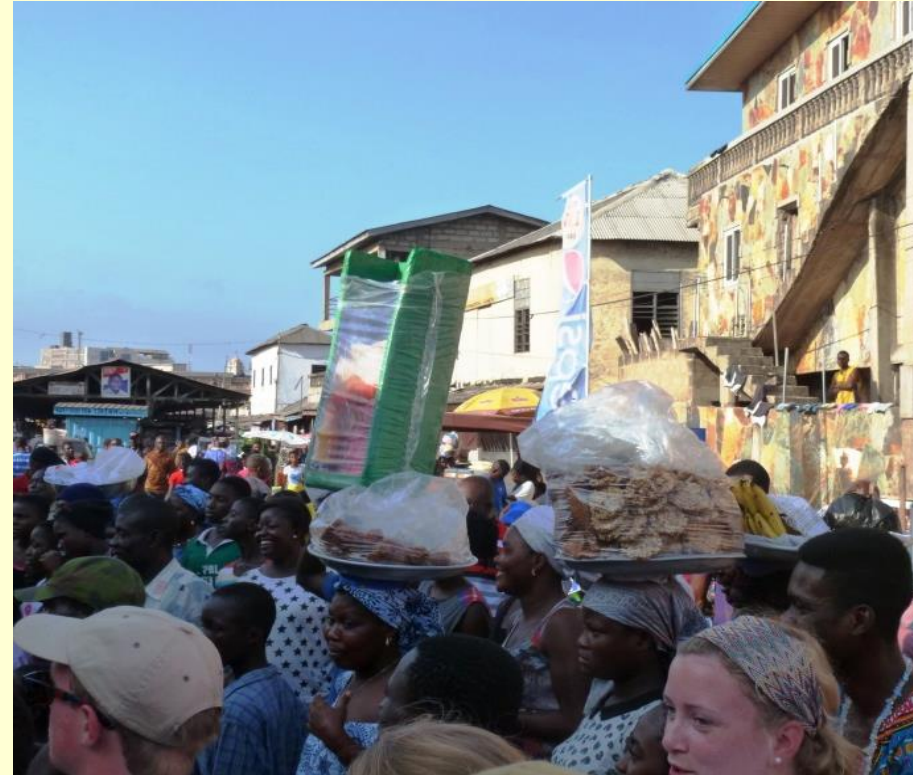
Markt und Gegend um alten Teil der Stadt Accra