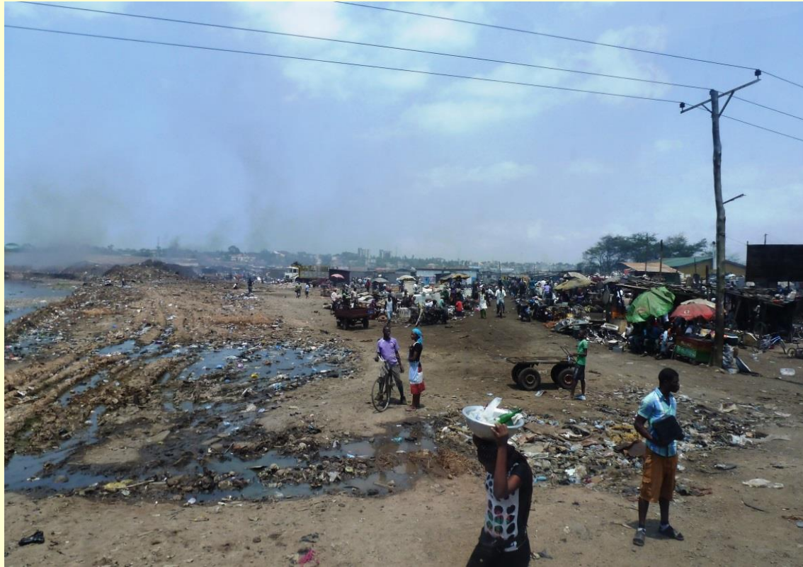
Stadtteil ‚Agbogbloshie‘, Accra