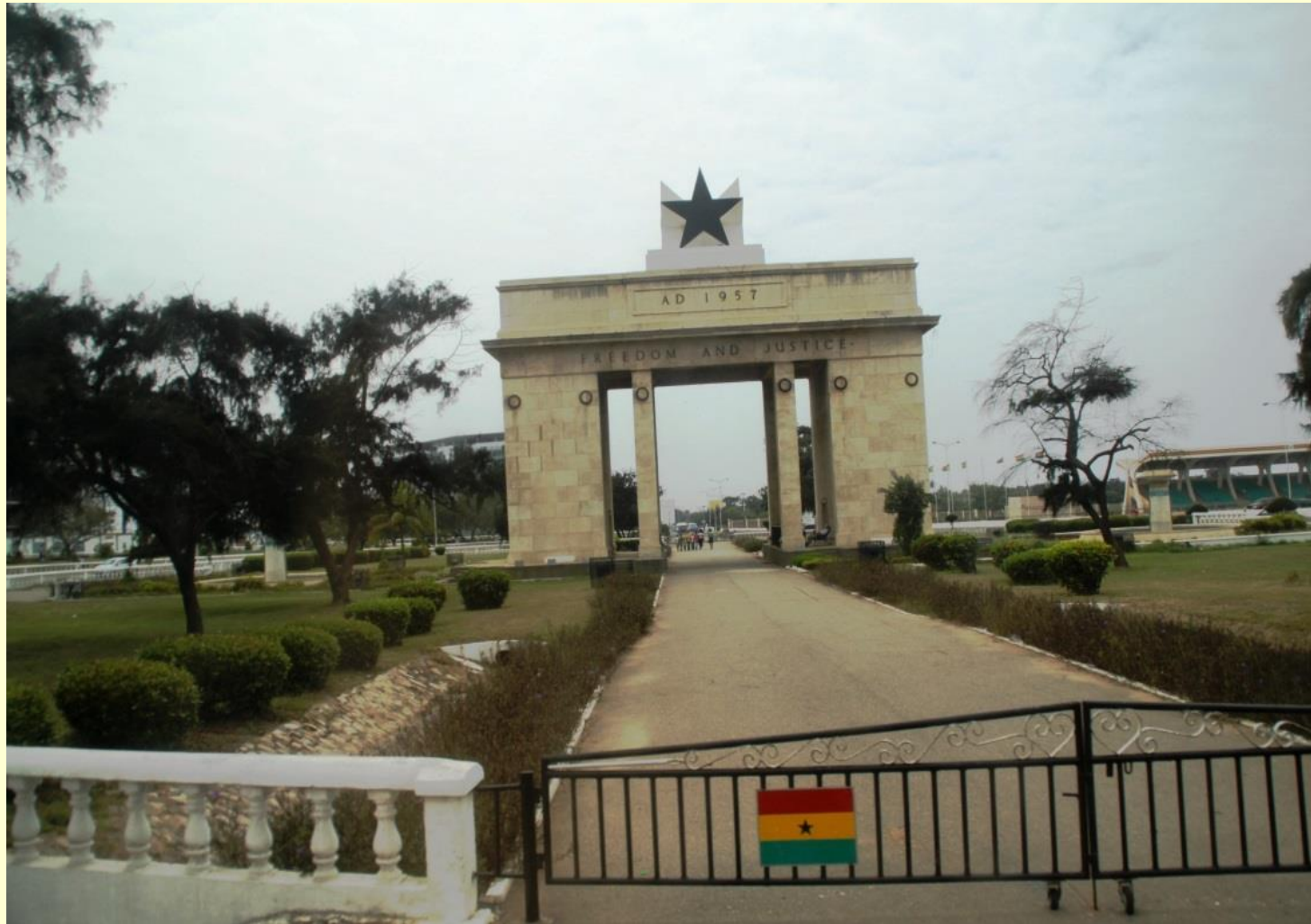
Der Triumphbogen in Accra