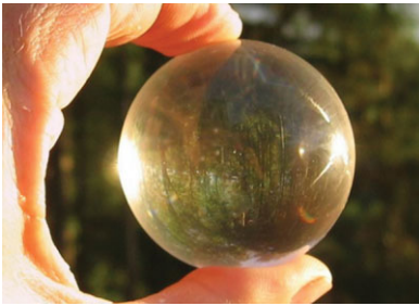
Abb. 1 Die vermeintliche Lichteintrittsöffnung (rechts) ist kleiner als die Austrittsöffnung (links).

Betrachtet man Wassertropfen oder Glaskugeln in der Sonne, so kann man den Eindruck gewinnen, ein Lichtstrahl würde die Kugel geradezu durchbohren. Gleichzeitig meint man, Eintritts- und Austrittsöffnung zu erkennen.