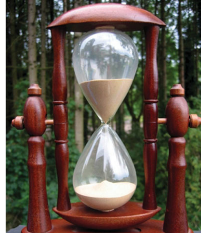
Abb. 1 Mit einer Sanduhr lässt sich die Zeit messen, weil die Geschwindigkeit, mit der das Granulat durch die Öffnung rieselt, nicht vom Füllstand abhängt.

Eine weitere verblüffende Möglichkeit, den Sandstrom zum Erliegen zu bringen besteht darin, den unteren Behälter mit den Händen zu umschmiegen. Nach einer Weile „steht