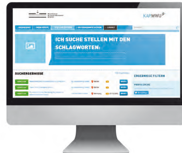
Hilfe bei der Stellensuche: das KAP.WWU

The University of Münster Careers Service provides students and alumni with a wide range of information and orientation offers in order to enable them to successfully begin their professional career after graduation. The service includes a seminar and workshop programme, individual advice, support regarding the financing of work placements, the adaptation of information sources, contacting employers, and a special career portal.