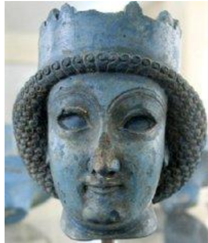
Kop van een Perzische vrouw uit Persepolis

Het Perzische Rijk was een wereldrijk, dat zich uitstrekte van Libië tot het huidige Afghanistan en zijn grootste omvang bereikte tijdens de regering van koning Darius I (522-485 v. Chr.). Natuurlijk zag het leven van een vrouw in het Perzische Rijk er heel anders uit dan dat van een vrouw vandaag de dag. Ze had andere vooruitzichten, een andere positie in de samenleving en was voor veel zaken afhankelijk van een man. Bij opgravingen in landen als Irak, Iran en Syrië hebben archeologen grote hoeveelheden kleitabletten blootgelegd, een schat aan informatie over het dagelijks leven, de cultuur en de religie van mensen die duizenden jaren geleden leefden in het gebied dat door geleerden het oude Nabije Oosten genoemd wordt. Deze belangrijke bronnen verschaften ook inzicht in de situatie van vrouwen in deze samenlevingen: we komen ze tegen in onder andere huwelijkscontracten, loonlijsten en brieven. Wie waren deze dames en hoe zag hun leven eruit?