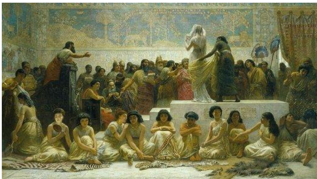
Een schilderij dat de Babylonische 'huwelijksmarkt' verbeeldt: 'The Babylonian Marriage Market' door Edwin Long

De enigen die niet afhankelijk waren van toestemming van ouders waren weduwen en gescheiden vrouwen. Scheiden was namelijk ook mogelijk, al was hier vaak wel een speciale reden voor nodig, zoals overspel of mishandeling. Na een scheiding kon zowel de man als de vrouw opnieuw trouwen. Overspel door de vrouw werd zwaar gestraft, omdat het dan niet duidelijk was wie de vader van een eventueel kind zou zijn. De belangrijkste 'taak' van de vrouw was namelijk het baren van legitieme kinderen. In het geval dat zij geen kinderen kon krijgen, mocht de man een tweede vrouw erbij nemen. Deze had dan wel een lagere status dan de eerste vrouw; het ging in veel gevallen om een slavin. In hogere kringen kwam het vaak voor dat een man meer dan één vrouw had, al was het huwelijk in principe monogaam. Alleen de koning hield er een hele harem op na. Dit had voornamelijk te maken met politieke doeleinden: vaak werd een alliantie met een koninklijk huwelijk bezegeld.