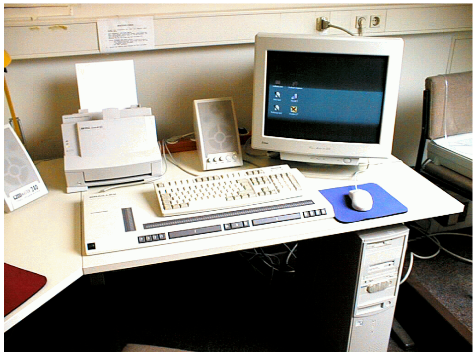
Der neue mit Hilfe der Kniese-Stiftung beschaffte Blindenarbeitsplatz

Der Wunsch, auch auf unseren Rechnern Windows-Anwendungen anzubieten, war mit