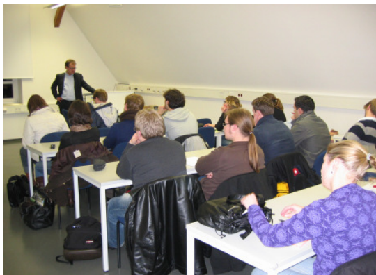
Vortrag The Phonehouse am 1.12.2008