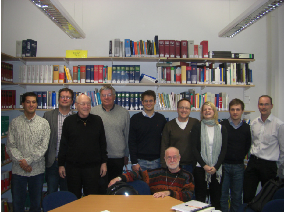
Teilnehmer des Workshops „Rechtinformatik“ (30.9.-2.10.2008 am ITM)